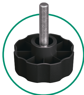
С БОЛТОМ И ЛЕПЕСТКОВОЙ РУКОЯТКОЙ (РЕЗЬБА ОТ М4 ДО М12)